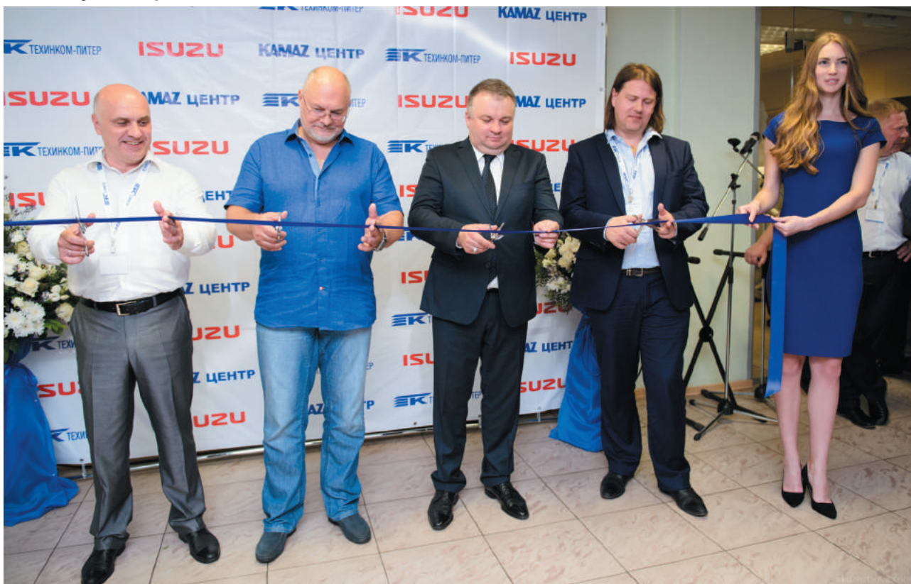
Церемония открытия торгово-сервисного комплекса ТЕХИНКОМ-ПИТЕР