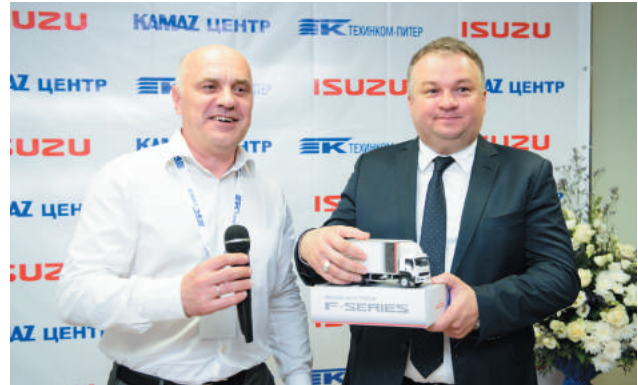
Вручение подарков гостям