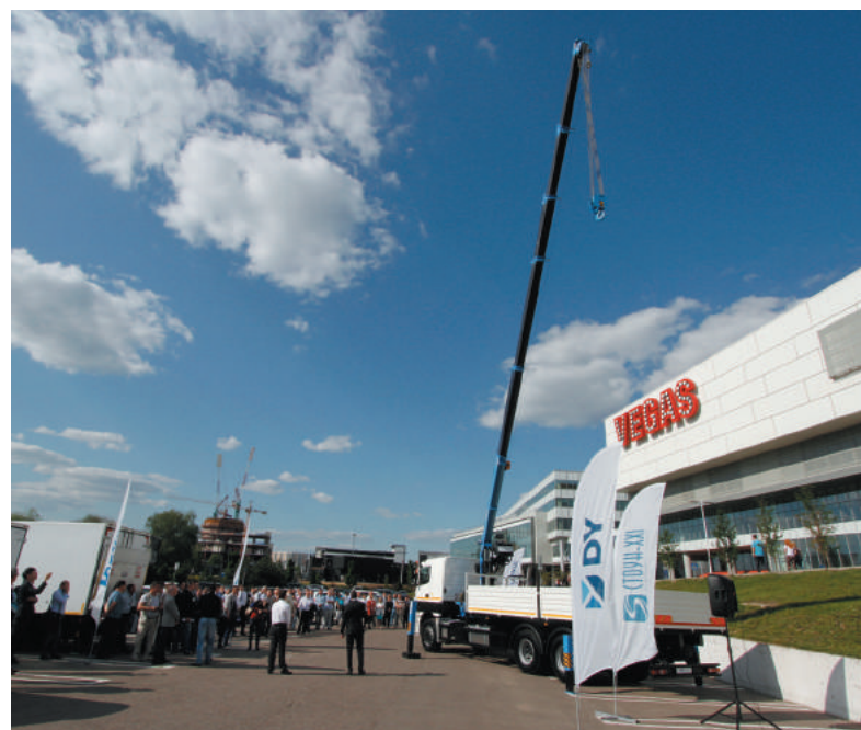
Презентация новинки КМУ DY SS1926 на шасси КАМАЗ-65207