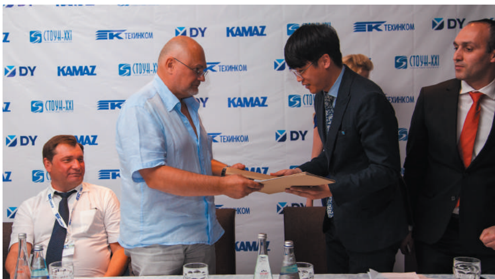
Подписание и передача дистрибьюторского соглашения

В рамках пресс-конференции состоялось подписание соглашения и передача сертификата Дис-