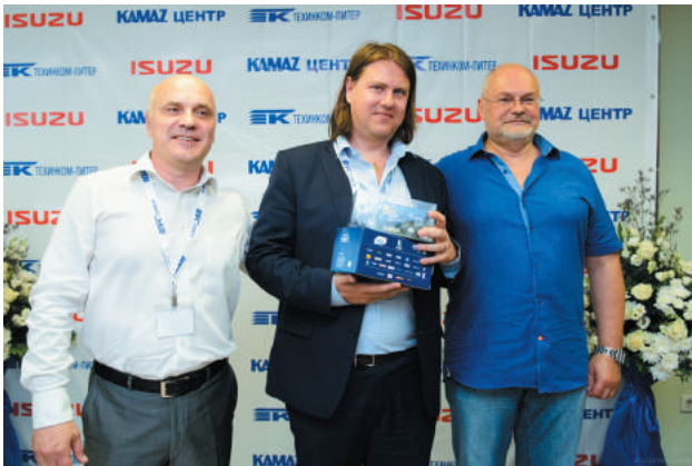
Вручение подарков гостям

Дилерский центр ТЕХИНКОМ-ПИТЕР расположен по адресу: г. Санкт-Петербург, Грузовой проезд, д. 27. Выполненный с учетом корпоративных стандартов KAMAZ и ISUZU , дилерский центр предлагает клиентам полный спектр услуг по продаже и техническому обслуживанию автомобилей и спецтехники KAMAZ и ISUZU , а также реализована возможность приобретения запасных частей прямо со склада.