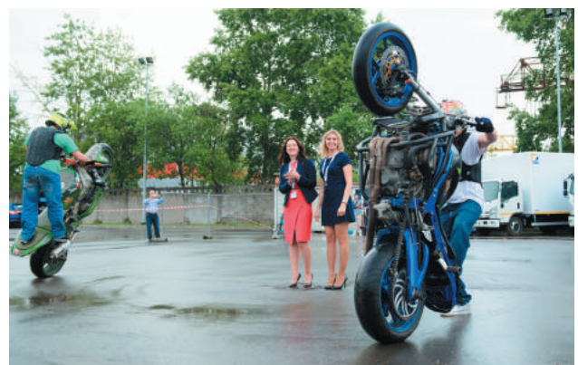
Развлекательная программа в рамках открытия ТСК